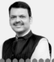
देवेंद्र फडणवीस मुख्यमंत्री