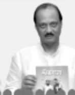
अजित पवार उपमुख्यमंत्री