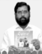
एकनाथ शिंदे उपमुख्यमंत्री