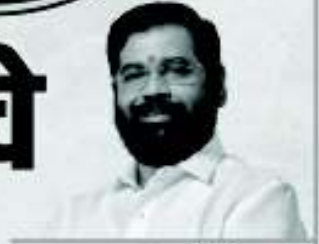
एकनाथ शिंदे मुख्यमंत्री

अधिस्विकृतीधारक पत्रकारांना शासनामार्फत देण्यात येणाऱ्या सुविधा :